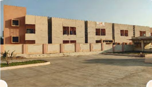
‘ગાર્ગી’ કન્યા છાત્રાલય