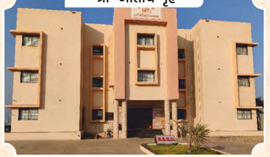
‘શ્રી’ અતિથિ ગૃહ