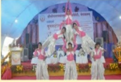
समापनसमारोहे विश्वविद्यालयच्छात्राभिः योगप्रदर्शनम्