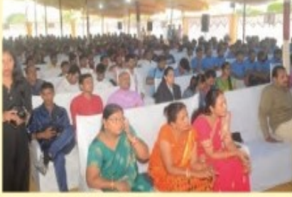
समापनकार्यक्रमे उपस्थिताः महानुभावाः स्पर्धालवश्च