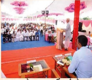
युवमहोत्सवस्य सम्पूर्तिकार्यक्रमे समवेताः प्रेक्षानाः