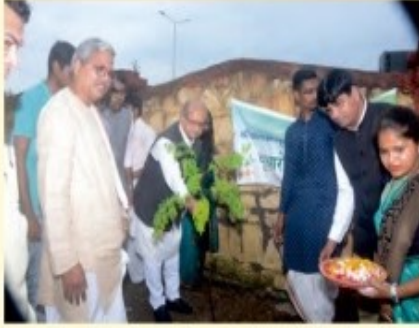
विश्वविद्यालयपरिसरे वृक्षारोपणं कुर्वन् माननीयः शिक्षणमन्त्री श्रीभूपेन्द्रसिंहचूडासमावर्यः