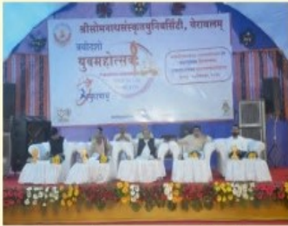
त्रयोदशयुवमहोत्सवस्य समापनसमारोहे उपस्थिताः शिक्षणमन्त्रिप्रभृतयः महानुभावाः

पूज्यमहाराजेन अस्मिन्नवसरे विश्वविद्यालयाय २,११,१११ रूप्यकाणां धनदानस्य उद्घोषणाऽपि अकारि।