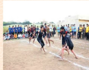
क्रीडास्पर्धांना किश्चित् छात्रौ