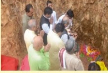
भूमिपूजनकार्यक्रमे महानुभावानाम् उपस्थितिः