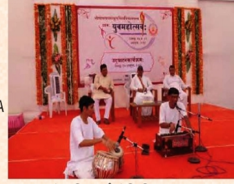
सांस्कृतिकस्पर्धांना किश्चित् दृश्यम् ।