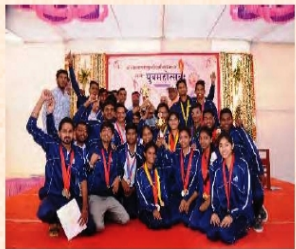
पारितोषिकं स्वीकुर्वन् स्पर्धालुगणः