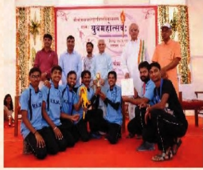
युवमहोत्सवस्य सम्पूर्तिकार्यक्रमस्य दृश्यम्