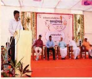
युवमहोत्सवस्य सम्पूर्तिकार्यक्रमस्य दृश्यम्