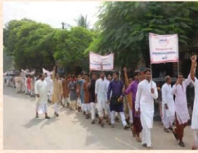
युवमहोत्सवस्य अङ्गतया समायोजिता शोभायात्रा