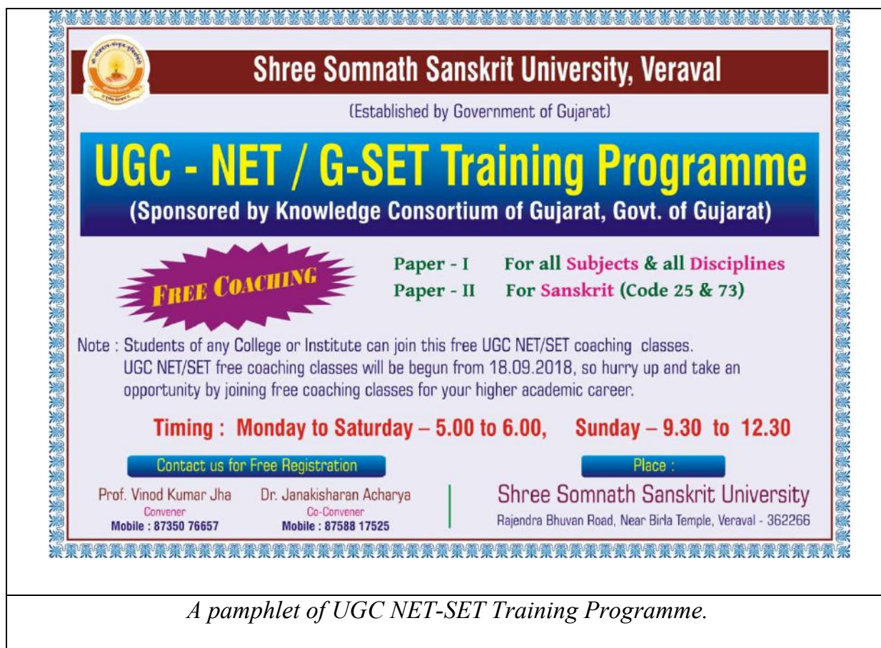
A pamphlet of UGC NET-SET Training Programme.