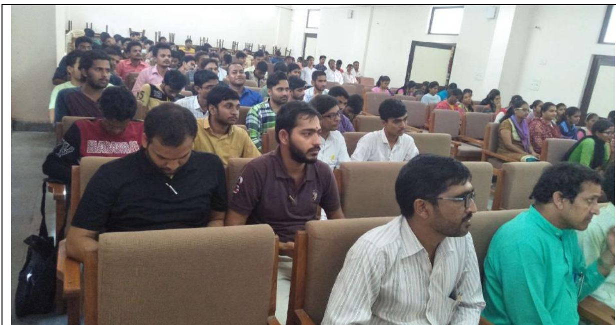
Inauguration of UGC-NET/SET Training program