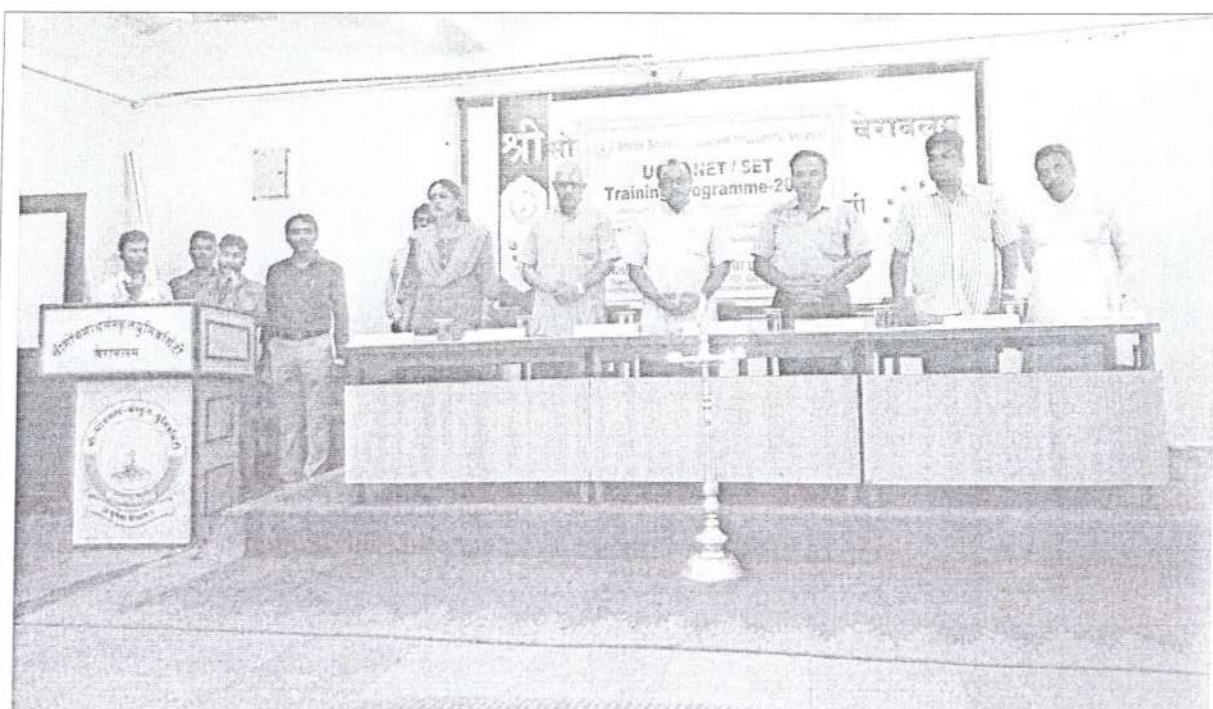
Inauguration of UGC-NET/SET Training program.