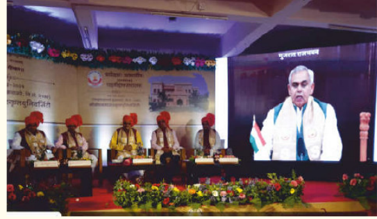
पदवीदानसमारोहे माननीयाः राज्यपालमहोदयाः