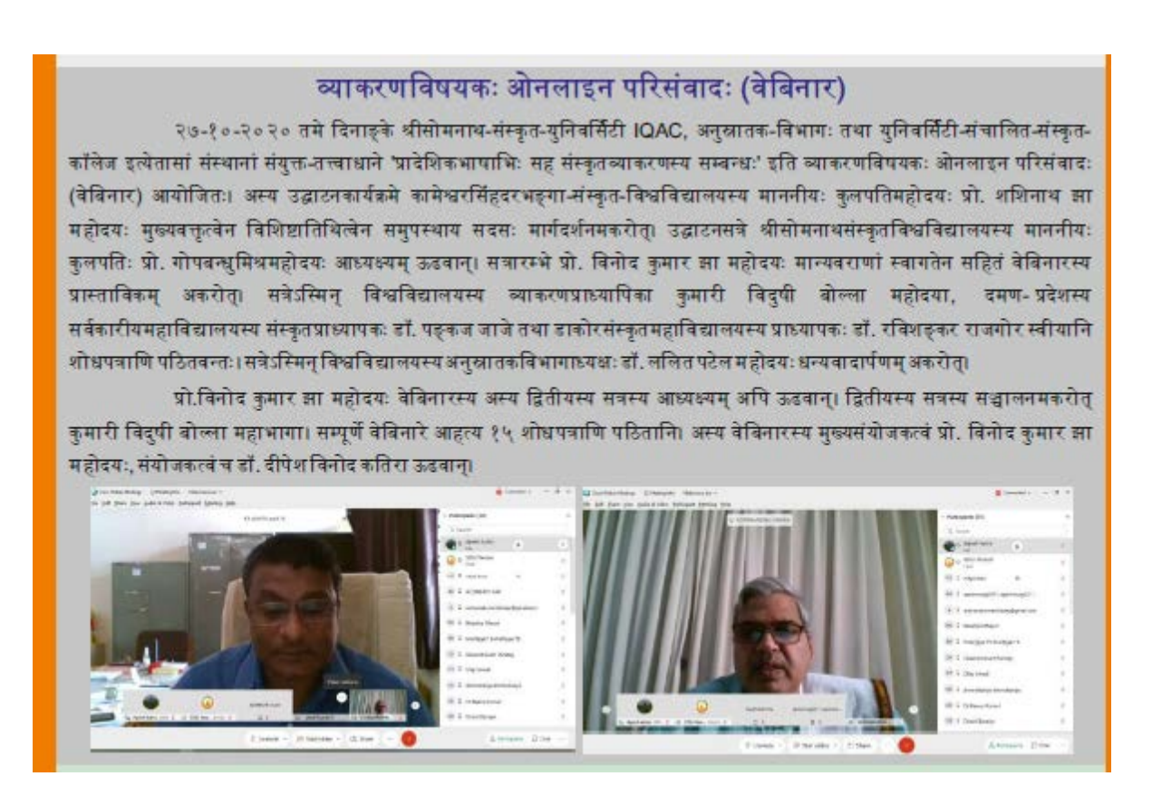
Somjyoti (The University News Letter – Issue 25 & 26 (July 2020 To December 2020), Page – 21